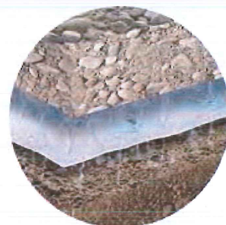
FILTRATION FILTRATION FILTRATION