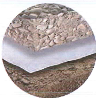
SEPARATION SEPARATION TRENNUNG