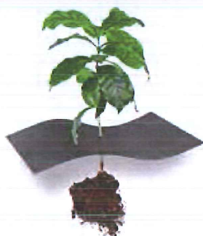
WEED CONTROL ANTI-RACINES STEUERUNG DER WURZELN