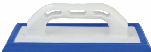
FRPLAINTON-01 Frattone spargibuiacca