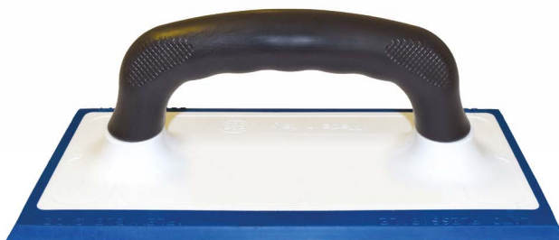
FRPLAINTON-01B Frattone spargibuiacca monoblocco